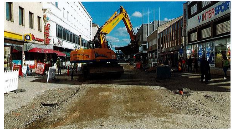
Kajaanin kävelypainotteiseen katuun laitettiin kesällä 2015 kainuulaista materiaalia, Ristijärven graniittia.

Urakoista maksetuista palkoista 84 prosenttia verotettiin Kuopioon, mikä on erittäin korkea taso. Myös rakentamisessa käytetyt materiaalit ja tavarat olivat tarkastelluissa urakoissa hankittu Kuopiosta tai lähialueelta, mikä vahvisti veropalauman määrää.