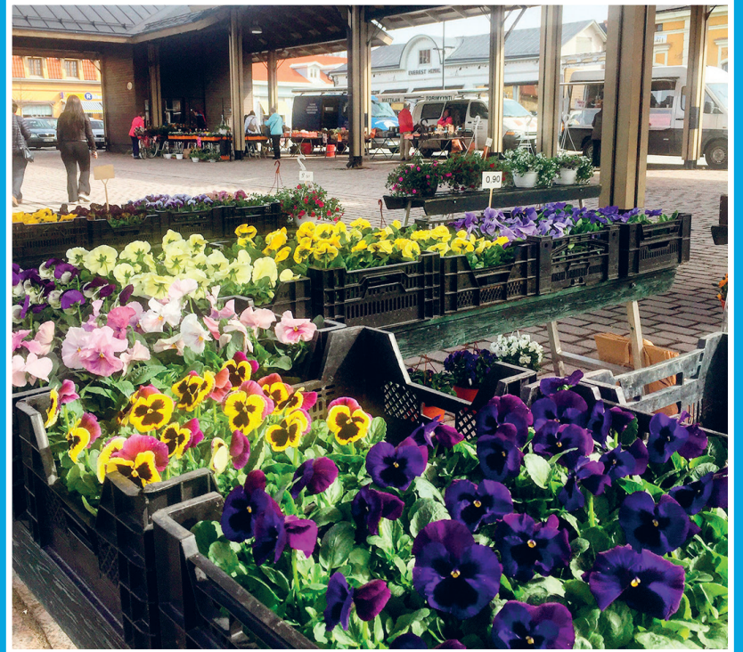
Kauppatori <3 #rakastunutraumaan #kauppatori #vanharauma

Rauman Yrittäjät ja Rakastunut Raumaan -toiminnan löydät facebookista. #raumanyrittajat #rakastunutraumaan