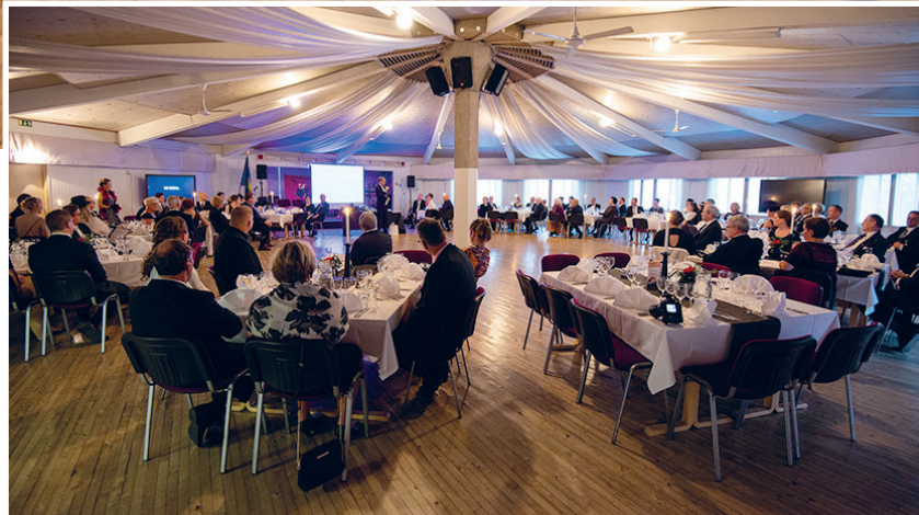
Syysjuhlakuvat Studio Raum