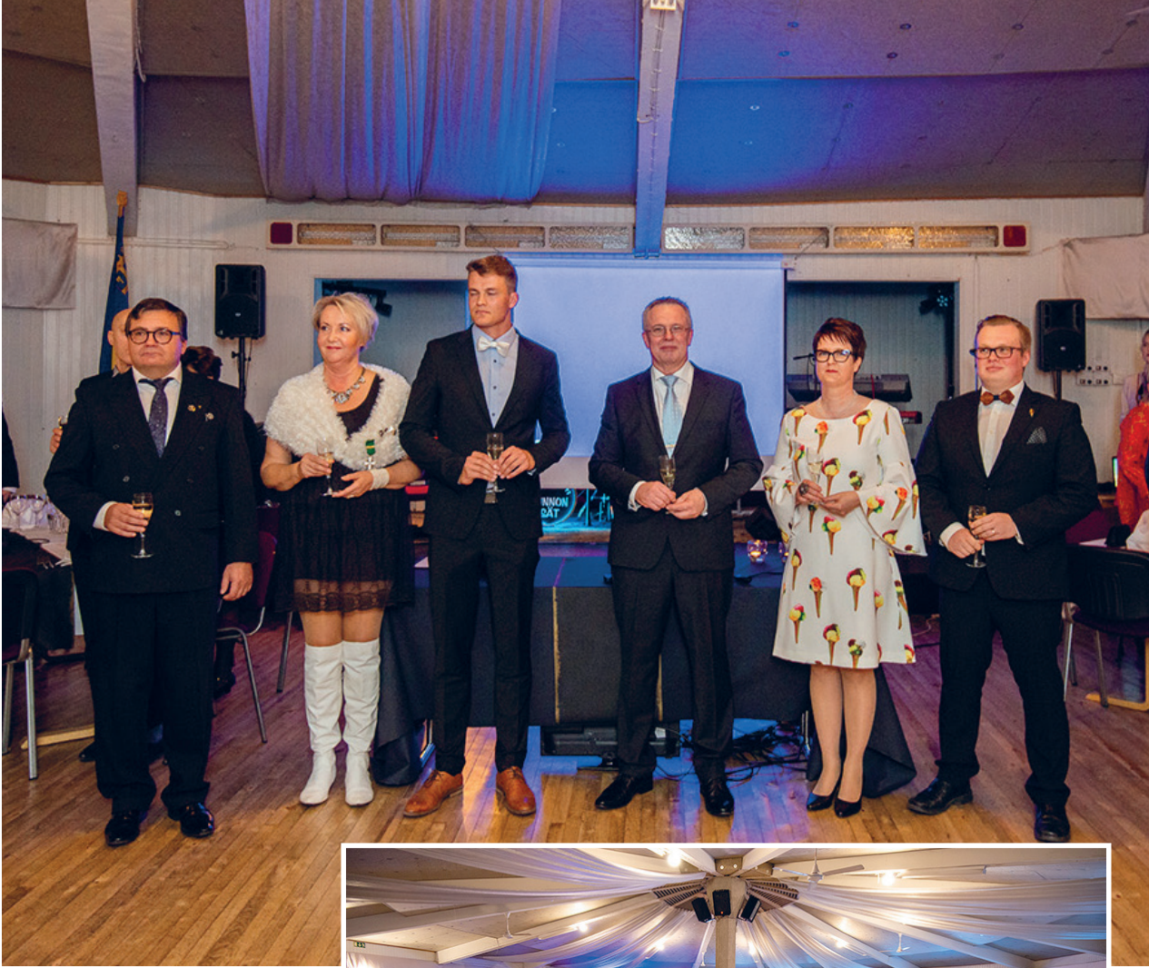
Syysjuhlissa juhlittiin ja palkittiin ansioituneita yrittäjiä. Osa vieraista oli pukeutunut teeman mukaisesti leffatähdeksi.

Rauman Yrittäjät - tekoja raumalaisen yrittäjän puolesta jo vuodesta 1936