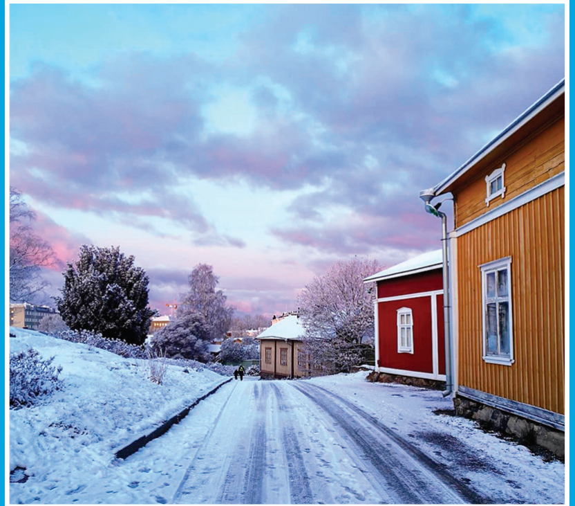
Rapsakka aamulenkki :)

Rauman Yrittäjät ja Rakastunut Raumaan -toiminnan löydät facebookista. #raumanyrittajat #rakastunutraumaan