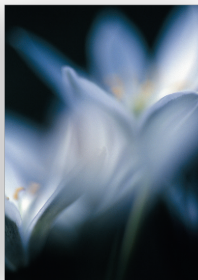
Lilja suruadressi myötätunnon osoittamiseen

Adressiin on sidottu nyöriyksellä tyhjä valkoinen sisälehti.