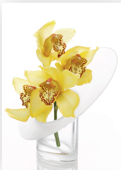
Orkidea onnitteluadressi onnitteluun ja kannustukseen