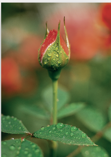
Ruusu onnitteluadressi onnitteluun ja kannustukseen