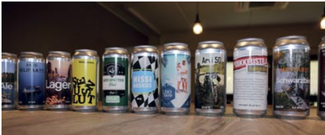
Pienpanimo myy tuotteitaan myös asiakkaiden haluamilla etiketeillä.

Jokaisella hyvinkääläispanimon oluella on oma hyvinkääläinen tarinansa. Tarjolla on muun muassa Paavola-lager, Parantola-IPA ja Vieremä-vehnäolut. Koska käymistankkeja on seitsemän, tarjolla on myös