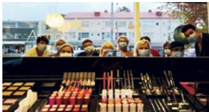
Hyvinkään Yrittäjien naisjaoston syyskuun kuukausitapaaminen oli Kauneushoitola Almondissa.

Yhdistyksen toiminta mietittiin: verkossa vai livenä? Itse olen fyysisten tapaamisten kannalla, joten me naisjaostolaiset tapasimme kesäkuussa piknikin merkeissä. Kirjastoaukio tarjosi meille oivan paikan – viltit, kuohuvat ja naposteltavat löysivät paikkansa. Aurinkokin oli meille suosiollinen, ja tarinaa ja juttua