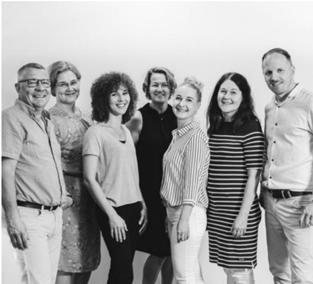
Hyria Business -palveluiden myynti/asiakkuustiimi.

Tämänkaltainen vuoropuhelu ja siitä syntyvä ymmärrys yritysten osaajatarpeesta on tärkeä yhteistyömuoto Hyrian ja työelämän välillä. Kun korona keväällä iski elinkeinoelämään, se näkyi ensimmäisenä palvelualoilla, ja monen oppisopimamme työelämässä oppimisen jakso joko koulutus- tai oppisopimuksella jouduttiin keskeyttämään.