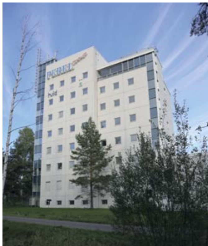
Moottoritien tuntumassa olevassa tornitalossa on Perel Group Oy:n pääkonttori ja Perel Oy:n toimisto ja keskusvarasto.

– Urakkatarjoukset oli käsitelty ja Haka valittu urakoitsijaksi. Sopimusta ei kuitenkaan ehditty tehdä, ja Haka meni sittemmin konkurssiin. Tässä rakennuksessa on Perel Oy:n varasto, minkä kautta kulkevat lähes kaikki konsernin eri yhtiöiden tavarat. Tontilla on valmiina perustukset ja pohjalaat-