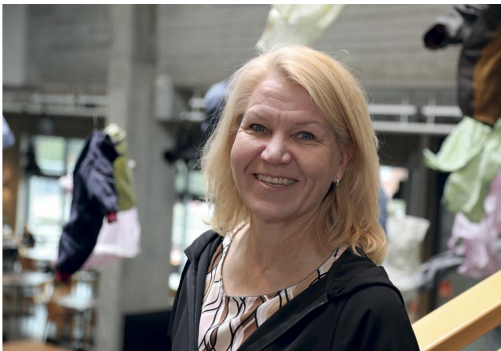
Käynnissä oleva hyvinvointialueiden perustaminen tulee työllistämään uutta kaupunginjohtajaa, onhan nyt vireillä oleva historian suurin hallinnollinen uudistus kunnille melkoinen elinvoimaksi.

– Koska en vielä tunne teitä kaikkia yritystoimijoita, niin tarttukaa rohkeasti hihasta, jos jossakin nähdään! Toivon, että tulevaisuudessa pidetään myös oikeita live-tilaisuuksia, joissa kohtaaminen on luontevaa ja keskustelulle on paremmin tilaa. Viedään Hyvinkään elinvoimaa eteenpäin yhdessä, vuoropuhelussa toistemme kanssa!