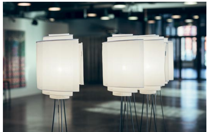
Doctor Design Oy:n designvalaisimia oli esillä Hyvinkään kaupungintalolla vuoden 2019 Halon yhteydessä järjestetyssä näyttelyssä.

Hyvinkään Halo -tapahtuman ohjelma ja kohdekartta löytyvät osoitteesta Hyvinkaanhalo.fi .