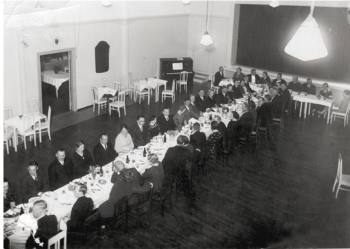
Varhaisimpia kuvia Hyvinkään Yrittäjien alkutaipaleelta on tämä kuva Y-viikon juhlista "Seurantaloilta". Kuvan vuosiluku ei ole tiedossa.

Monenlaisia juhlia ja tapahtumia järjestettiin vuosien varrella. 1956 yhdistyksen 30-vuo-