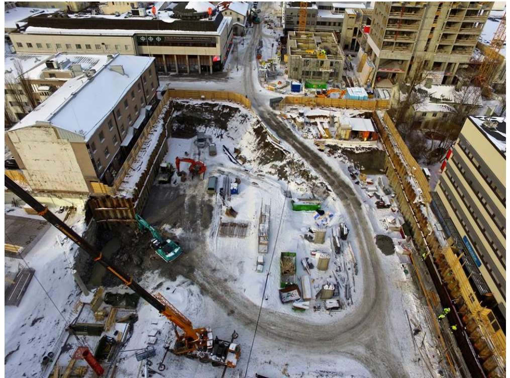
Seinäjoen keskusta muuttui rytinällä vuoden 2017 aikana.