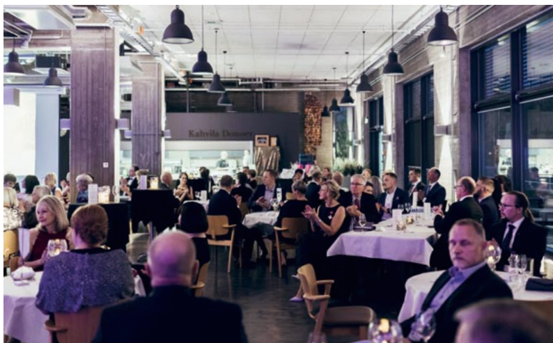
Kaupungintalon aula eli kaupungin olohuone tarjosi hienot puitteet Hyvinkään Yrittäjien 96-vuotisjuhla.