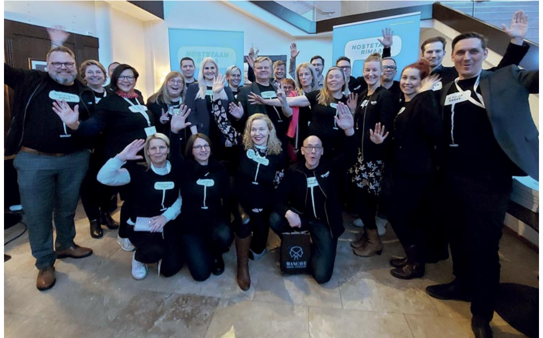
Uudenmaan Yrittäjien väki iloitsi saamastaan parhaan aluejärjestökumppanin tunnustuksesta.

– Yhteistyökumppaneilta saamamme hieno tunnustus tuntuu ihan huikealta onnistumiselta. Se inspiroi ja innostaa. Tähän hetkeen on hyvä pysäh-