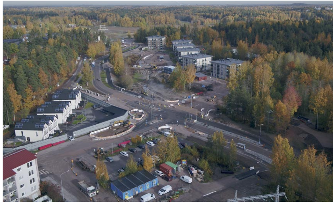
Espoossa Kilonkartanon tien peruskorjaus sekä tekniikan siirtäminen maan alle junaradan alituksen oli Tieluiska Oy:n toteuttama mittava urakka.

Vuonna 1982 yritys hankki Sahanmäestä tontin, ja Harkko-