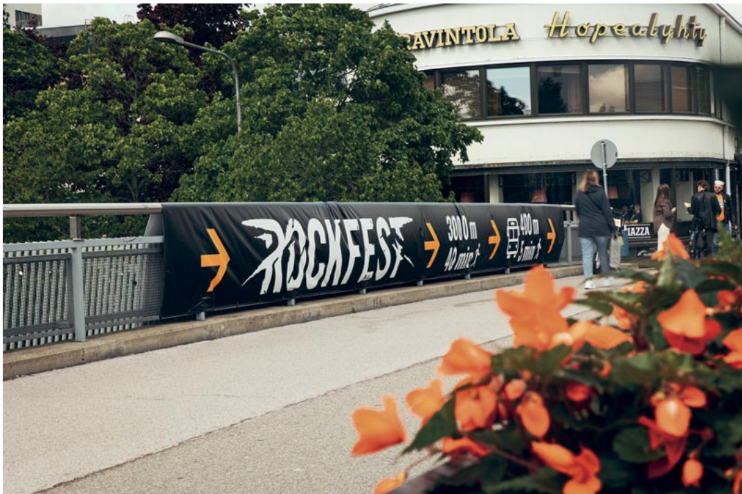
Kaupunki panostaa tapahtumissa muun muassa kevyen liikenteen opasteisiin.

Kaikki Hyvinkään kesän päätapahtumat kannustavat