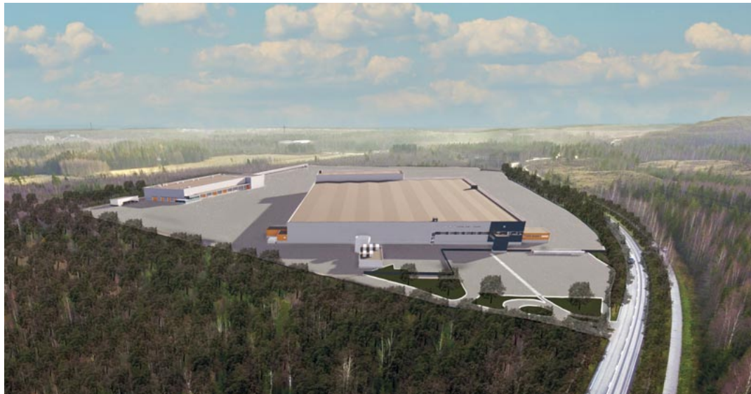
Kesko rakentaa Hyvinkäälle Pohjoisen Kehätien tuntumaan Onnisen ja K-Auton käyttöön 82 000 neliömetrin kokoisen logistiikkakeskuksen, joka valmistuu vaiheittain vuosien 2025–30 aikana.

Lisäksi viime vuonna tehtiin päätökset kaupungin palveluverkosta ja keskustan kehittämisuunnitelmasta sekä useista elinkeinohankkeista, kuten Kesko / Onnisen logistiikkakeskuksen kaavapäätös. Näiden lisäksi on vielä tulossa työllisyys- ja elinkeinopalveluiden laajamittainen valtakunnallinen uudistus, jolla työ- ja elinkeinopalveluja siirretään TE-toimistoilta ja ELY-keskuksilta kuntien