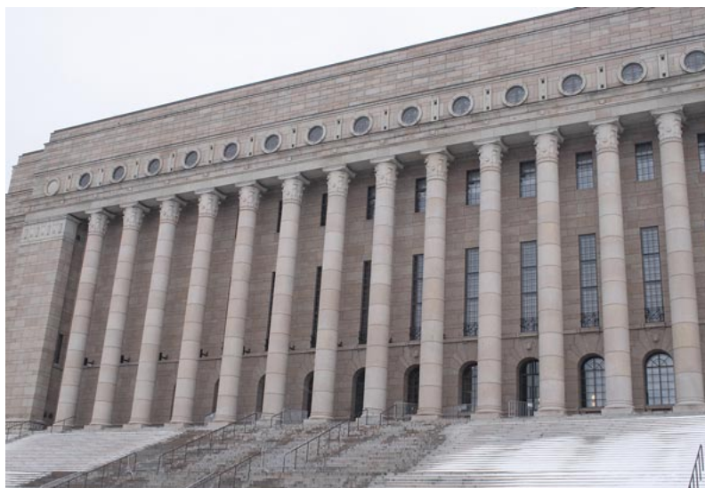
Eduskuntatalo maaliskuussa 2023.