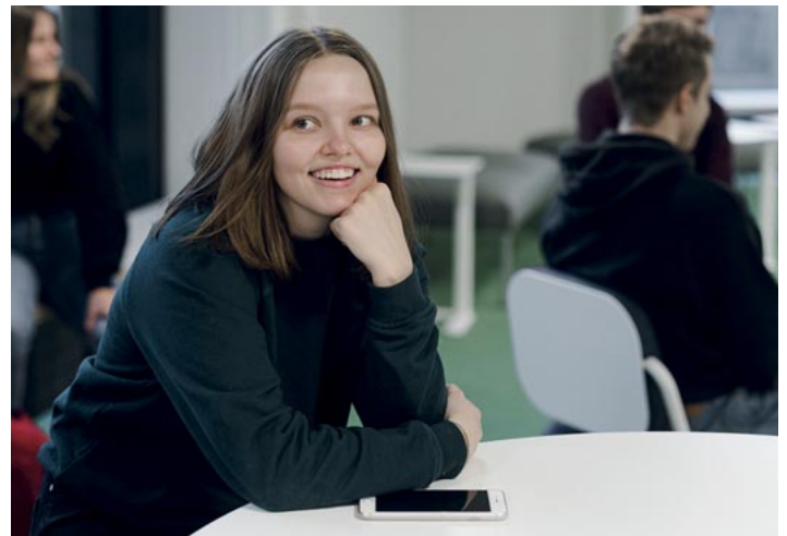
Hyvinkään kaupunki tukee yrityksiä hyvinkääläisten nuorten kesätyöllistämässä.

hyvinkaa.fi => yritystoiminta ja työ => työllisyyspalvelut => kesätyöseteli