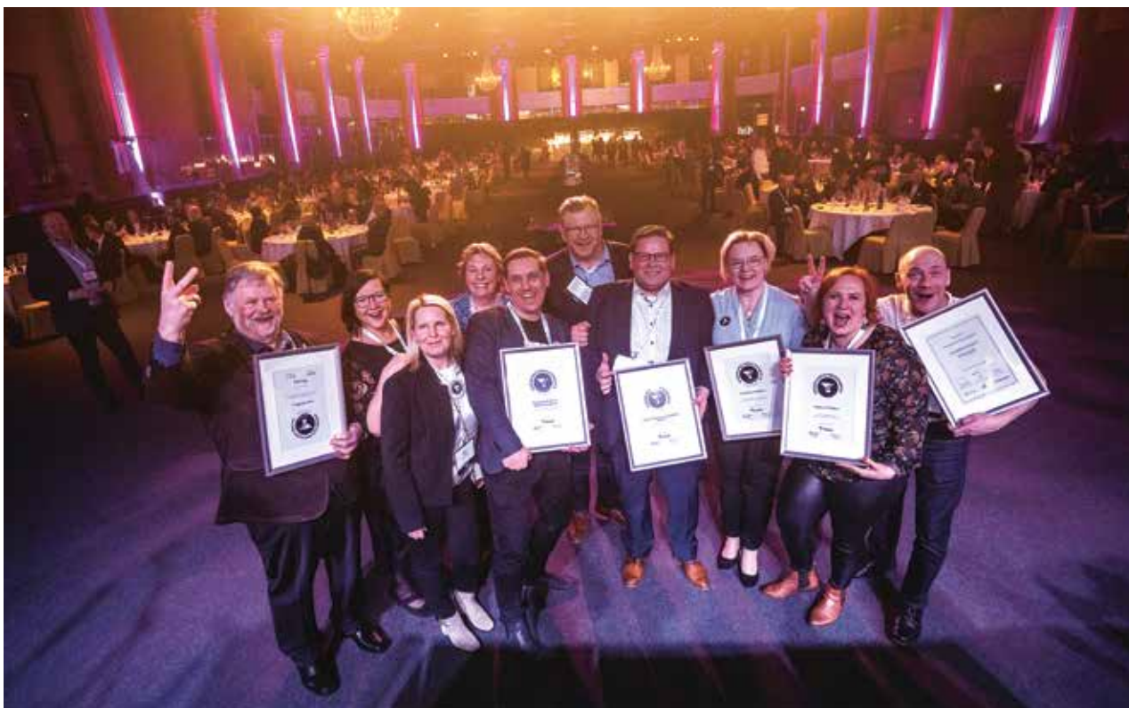
Suomen Yrittäjien vuoden 2022 parhaat paikallisyhdistykset ja toimialajärjestö palkittiin Vaikuttajafoorumissa Lappeenrannassa.

Juuan Yrittäjät, Isonkyrön Yrittäjät, Ulvilan Yrittäjät sekä Porvoon Yrittäjät palkittiin Suomen Yrittäjien vuoden 2022 parhaina paikallisyhdistyksinä. Vuoden 2022 toimialajärjestö on Suomen kuljetus ja logistiikka SKAL.