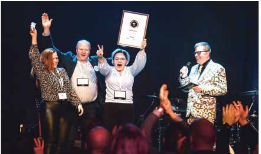
Isonkyrön Yrittäjät palkittiin parhaana 100-200 jäsenen sarjassa.