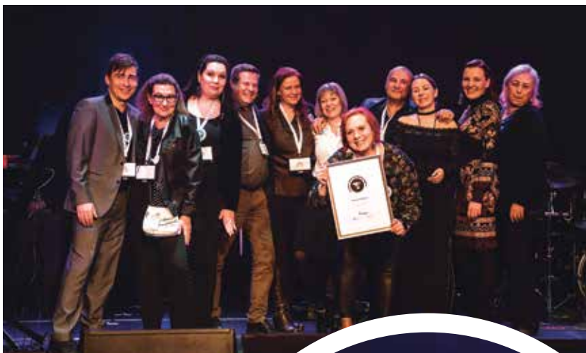
Nokian Yrittäjät palkittiin kunniamaininnalla.

Suomen Kuljetus ja Logistiikka SKAL ry palkittiin Suomen Yrittäjien vuoden toimialajärjestönä. SKAL on tehnyt vaikuttavaa ja tuloksekasta edunvalvontaa, kun polttoainekustannukset ovat nousseet rajusti mm. Ukrainan sodan takia. SKAL vaikutti vahvasti jakeluvalvoitteen keventämiseen, kuljetusyritysten polttoainetukeen ja ammattidieselin valmistelun käynnistämiseen. Järjestön viestintä on aktiivista ja näkyvää niin medialle kuin jäsenilleen. Järjestön palveluntarjonta jäsenilleen on monipuolista ja siihen on panostettu. Toimintaa kehitetään jatkuvasti. Toimialajärjestöllä on myös vahvaa yhteistyötä Suomen Yrittäjien kanssa.