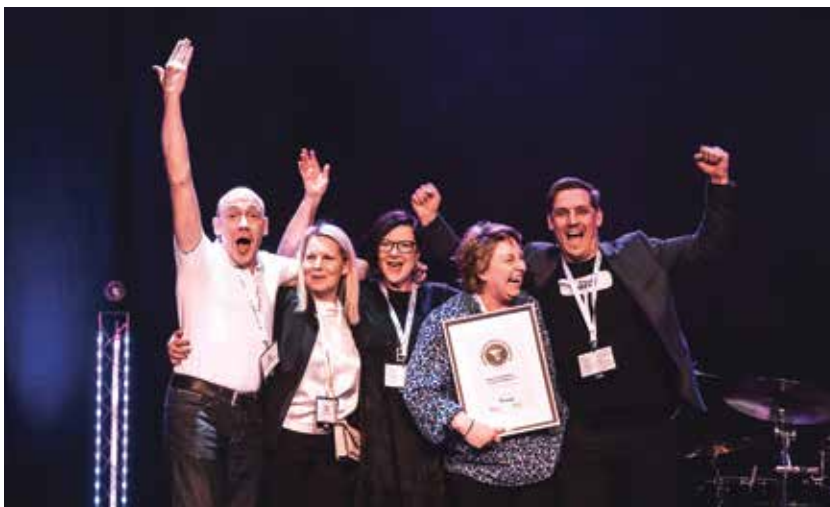
Porvoon Yrittäjät palkittiin isoimpien paikallisyhdistysten sarjassa.