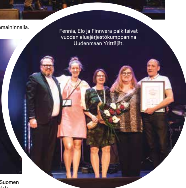
Fennia, Elo ja Finnvera palkitsivat vuoden aluejärjestökumppanina Uudenmaan Yrittäjät.