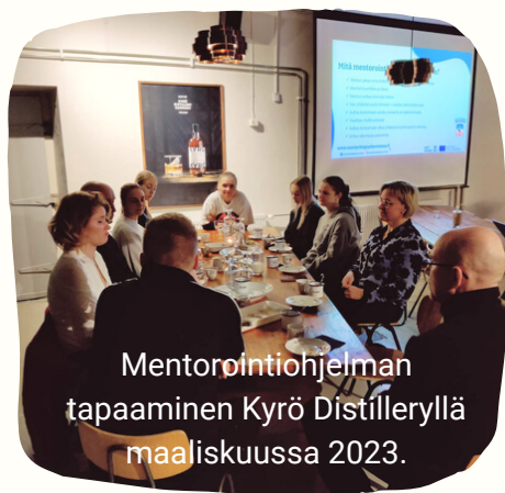
Mentorointiohjelman tapaaminen Kyrö Distilleryllä maaliskuussa 2023.

"Mentorin ei siis tarvitse olla yritysneuvoja, vaan oman kokemuksensa ansiosta kyrönmaalainen aikuinen ja yrittäjä on erinomainen tuki nuorelle."