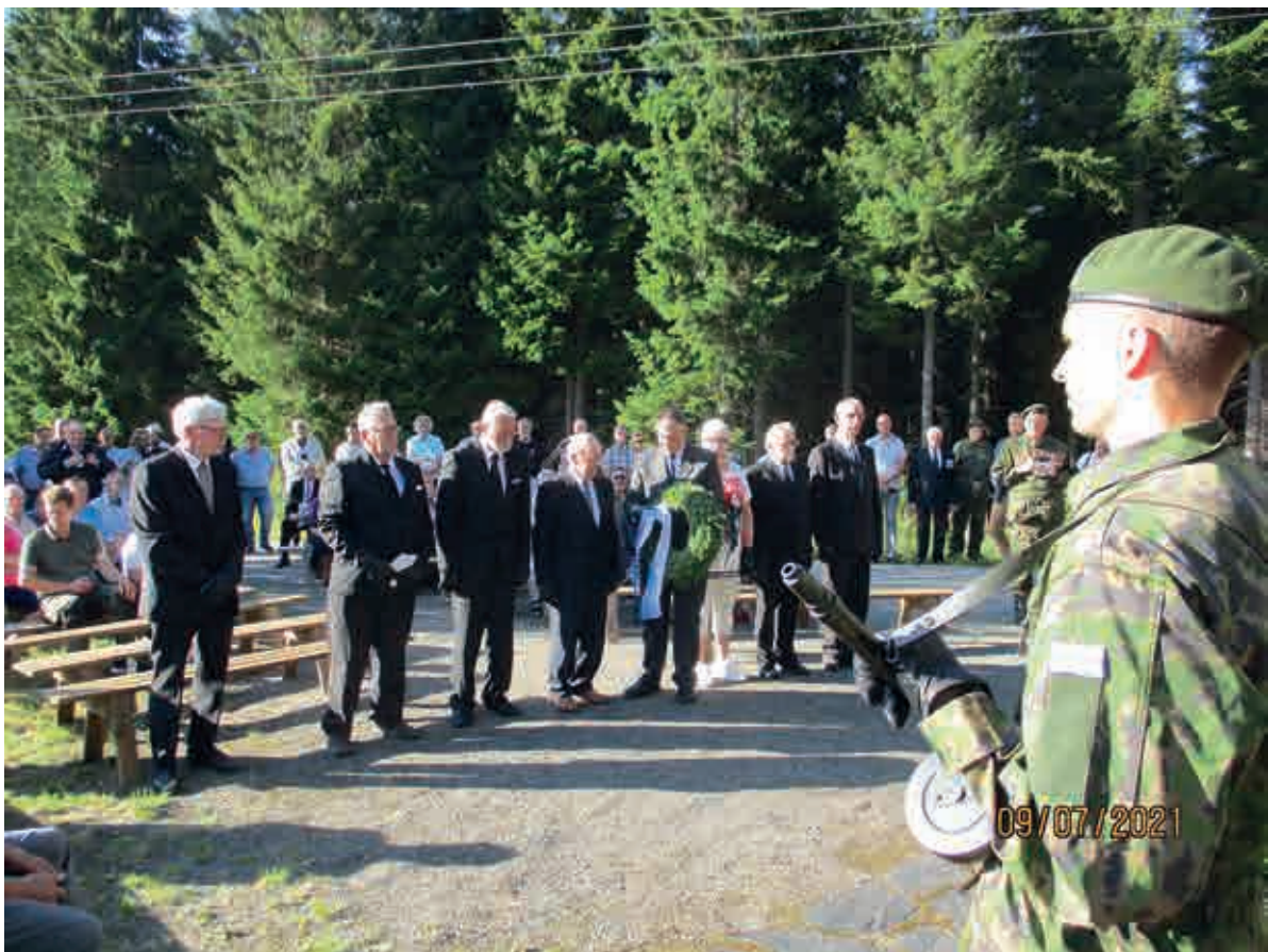
Kaatuneiden jälkeläiset laskivat havuseppeleen juhlassa muistomerkille.