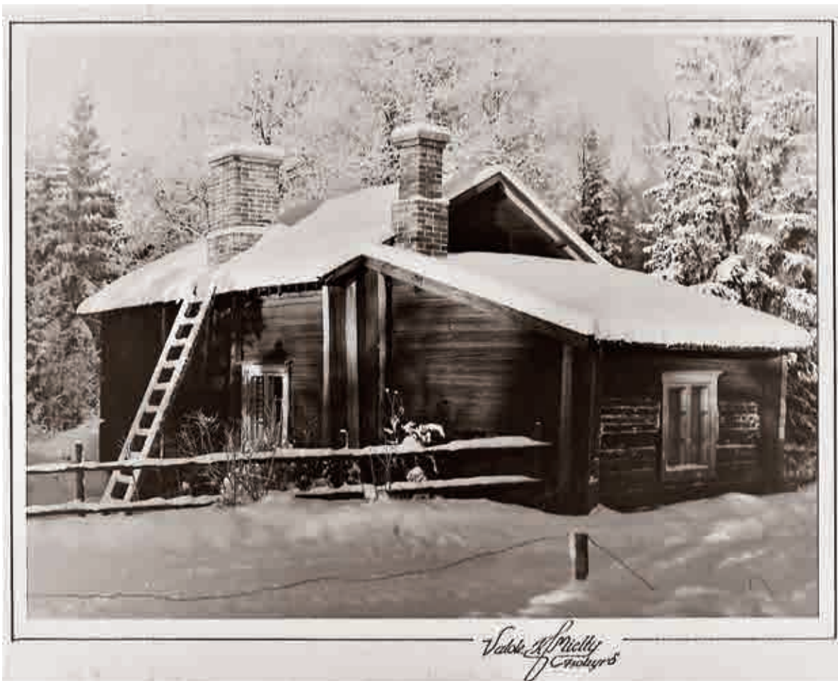
Kuvassa on 1960-luvulla kuvattu väkkärintupa

Isonkyrön vanhan kirkon aluetta kutsuttiin aikanaan “kirkkokaupunki” nimellä. Kirkon läheisyyteen oli rakennettu kirkonkävijöille majapaikkoja eli kirkontalleista ja tuvista kehittyi lähiö. Kyrönjoen eteläiselle rantatörmälle rakennettiin myös uudelleen väkkärintupa, jota paranneltiin 1700-luvulla ajan vaatimuksia vastaavaksi. Savukiuas sai väistyä ja tilalle muurattiin savuhormilla sekä pelillä varustettu avotakka. Samalla sivuseinän pieni ikkuna suurennettiin.