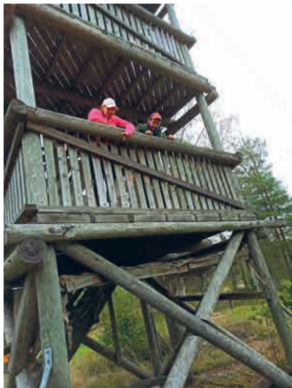
Osallistujissa oli myös ulkopaikkakuntalaisia. Kuvassa Kurikan reserviupseerikerhon puheenjohtaja kumppaninsa kanssa tikanpudotusrastilla.

Elokuussa miteltiin Reserviläisurheiluliiton Suomen mestaruuksista Ylipäässä frisbeegolfissa. Isonkyrön reserviläisjärjestöt järjestivät ensimmäiset Ylipään frisbeegolfradan SM-tason kilpailut. Teknistä asiantuntija-apua saatiin paikallisen Discgolf club Isonkyrön (DGCl:n) Pasi Kangasmäeltä ja Sami Nikulalta. Reserviläisjärjestöjen yhteinen kevät- ja syyskokous järjestettiin lokakuun lopulla Pohjankyrön talolla, jossa ennen varsinaisen kokouksen alkamista oli kaikille avoin 72 h-varautumiskoulutus. Koulutus käsitteli sitä, miten kotitalouksien tulisi varautua mahdollisia häiriötilanteita varten, kuinka tärkeää olisi, että jokaisesta taloudesta löytyisi kolmen vuorokauden tarvetta vastaava määrä elintarvikkeita ja muita päivittäin tarvittavia asioita.