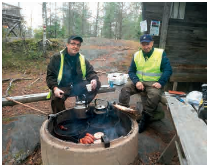
Osallistujille tarjottiin huoltorastilla nokipannukahvit, mehua sekä makkaraa.