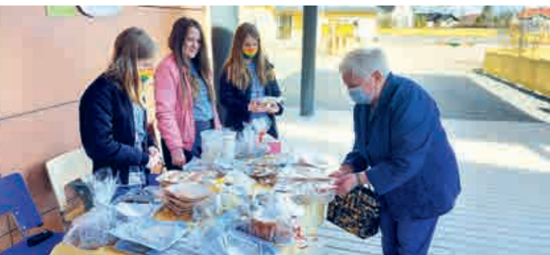
Take Away -leivonnaismyynti

Kylkkälän koulun 5-6 luokassa käy kuhina. Monialaisten opintojen viikot eli tuttavallisimmin MOK- viikot ovat alkamaisillaan. Pienissä ryhmissä on lyöty päät yhteen ja ideointi käy kuumana. Suunnittelupaperille alkaa kehkeytyä toinen toistaan mielenkiintoisempia ja toteuttamiskelpoisia pikkufirmoja.