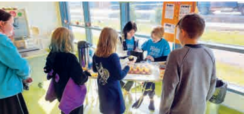
Miss Buffet -kahvila