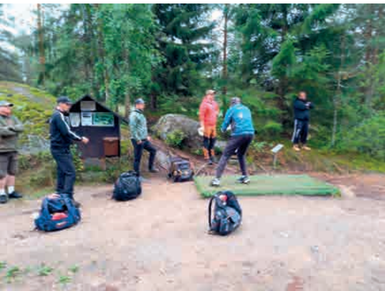
Miesten yleisen sarjan ryhmä aloittamassa toista kierrosta.

kilpailun vanhoilla kuntarajoilla. Isokyrö voitti kilpailun ylivoimaisesti sillä 5,5 % asukkaista suoritti marssin, kun toiseksi tulleella Jurvalla vastaava prosenttiluku oli yli puolet pienempi.