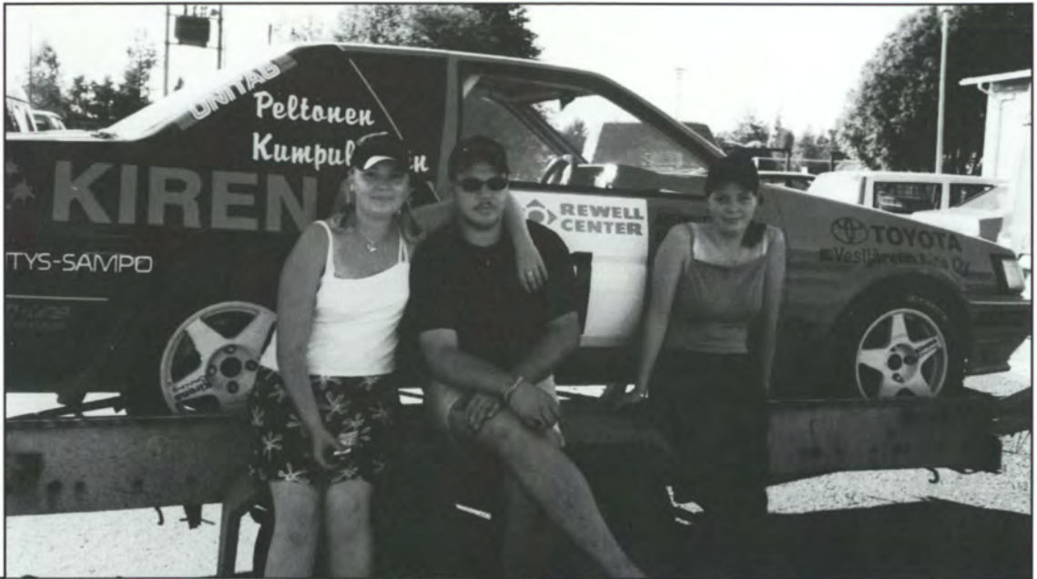
Rewell-centerralli F-cupin osakilpailu 31.7.1999