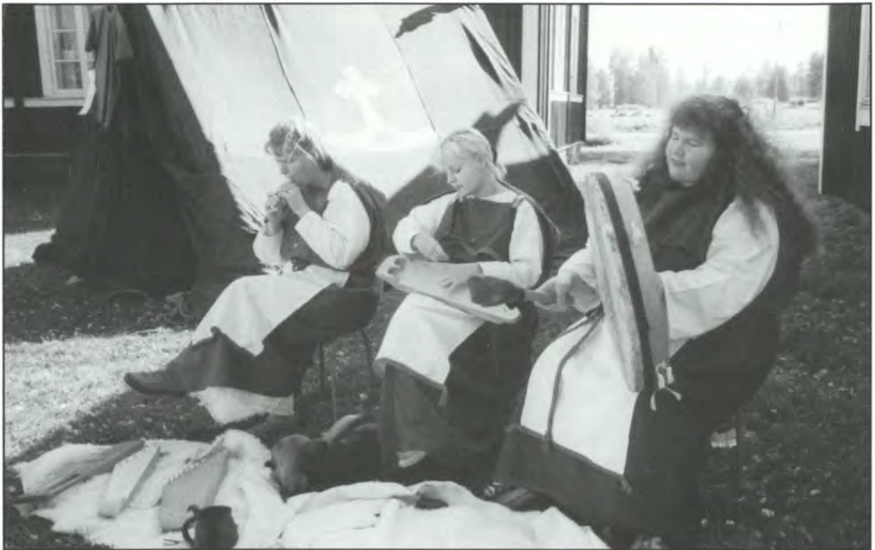
Viikinkiaikaista musiikkia esitti Tsakku, kolmen naisen yhtye. Soittimina ovat vanhojen hautalöytöjen pohjalta valmistetut shamaanirummut, kanteleet, tinapilli, luuhuilu ja jouhikko.

pääset siihen tutustumaan heidän internet sivujen välityksellä.