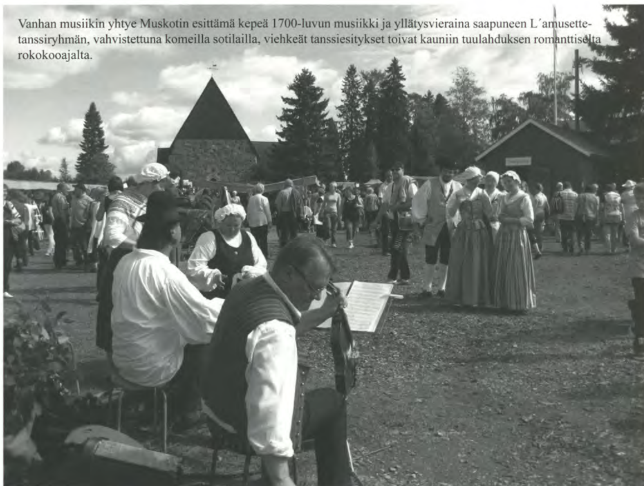
Vanhan musiikin yhtye Muskotin esittämä kepeä 1700-luvun musiikki ja yllätysvieraina saapuneen L'amusette-tanssiryhmän, vahvistettuna komeilla sotilailta, viehkeät tanssiesitykset toivat kauniin tuulahduksen romanttiselta rokokooajalta.