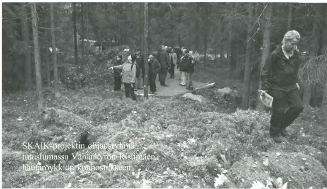
SKAIK-projektin ohjausryhmä tutustumassa Vähänkyrön Ristimäen hautaröykkiön kunnostukseen.

Leväluhta kiehtoo tutkijoita edelleen ja parhaillaan on käynnissä Helsingin yliopiston monitieteellinen tutkimusprojekti, jossa löytöjä ja alueen ympäristöä tutkitaan uusien menetelmin.