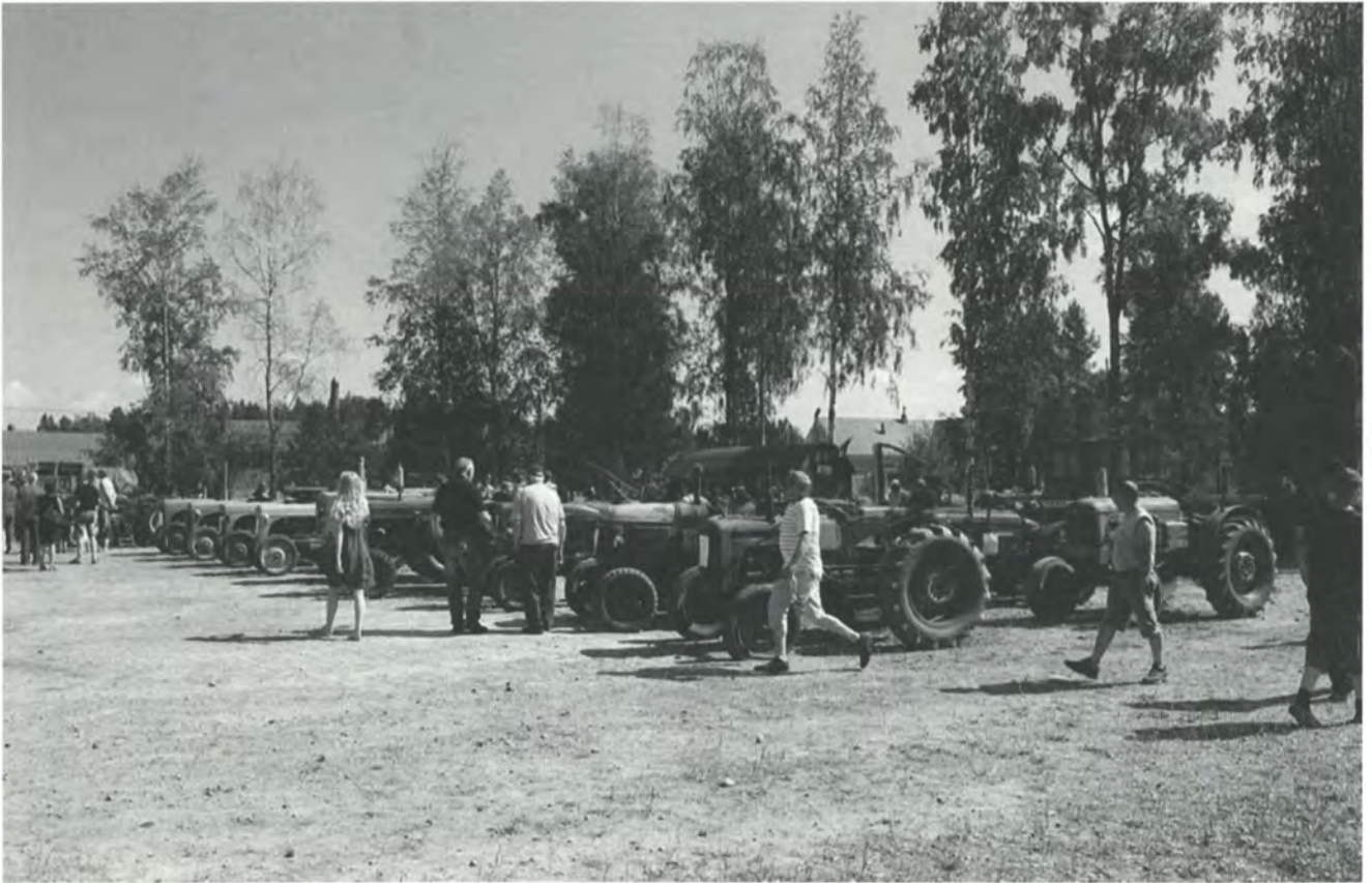
Sirpistä Puimuriin -tapahtuma 27-28.7 keräsi jälleen runsaasti vanhoista koneista ja työtavoista kiinnostunutta väkeä maatalousmuseon alueelle. Esillä oli toinen toistaan komeampia, huolella entisöityjä työkoneita ihmisten ihmeteltävinä. Aurinkoinen päivä suosi niin kävijöitä kuin tilaisuuden järjestäjiä.