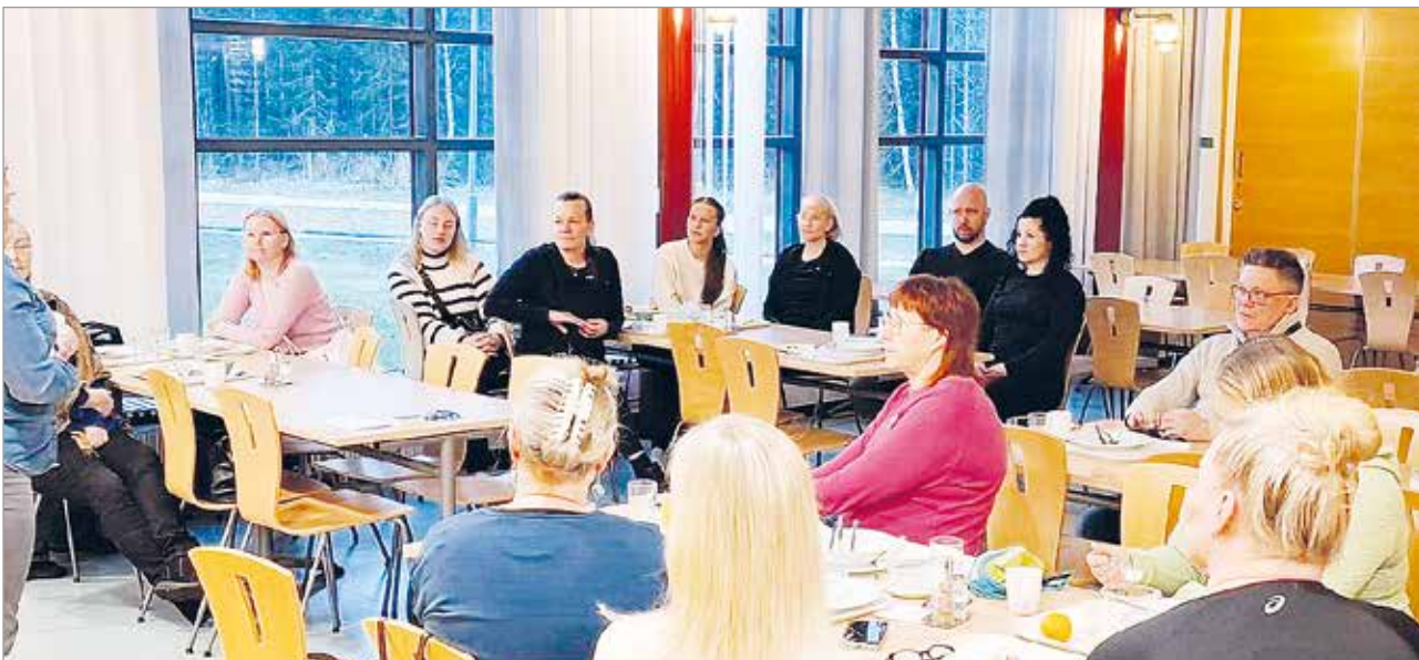
Iiläisiä yrittäjiä kokoontui yhteiselle aamupalalle ravintola Chuan Yi Micropolikseen.